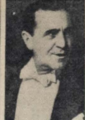
Chanceler João Neves

A COFAP ajudará a pesca no nordeste — Serão adquiridos 30 barcos a motor — Caminhões para o transporte de pescados — Nova mina de ouro no interior do Território do Amapá