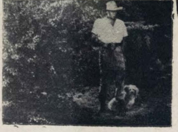
"A marca do Gorila"