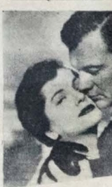
Uma mulher que procura fugir de si mesma. Uma jovem que espera encontrar um homem que se comporte para enchê-la e desembrançar os ornatos naturais da Ilha de Capri, Nápoles, Itália.