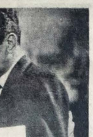
Um homem que procura fugir de si mesmo. Uma jovem que espera encontrar um homem que se comporte para enchê-la e desembrançar os ornatos naturais da Ilha de Capri, Nápoles, Itália.