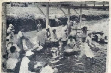
Flagrante colhida na lavanderia do rio Jaguaribe, onde aparecem as lavadeiras em plena faina. O trabalho é duro, e quando era sob o sol e a chuva nem é bom falar.