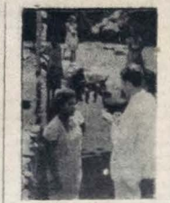
Reportando-se à construção da lavanderia sobre o rio Jaguaribe, esta lavadeira disse: "Foi muito bom, o Governo para nós. Bem ali, de mais".