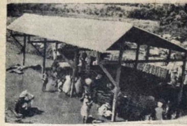
A foto acima, colhida pela reportagem fotográfica de A UNIÃO, fixa uma vista geral da lavanderia construída pelo Governo do Estado, vendo-se as lavadeiras em pleno trabalho, já agora livres das soalheiras e abrigo da chuva.