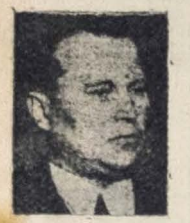
Jacob Malik, delegada Soviética no Conselho de Segurança da O. N. U.

A pretensa guerra bacteriológica na Coreia — 9 votos favoráveis ao representante russo e abstenção do Paquistão — O 50.º Voto da União Soviética na ONU