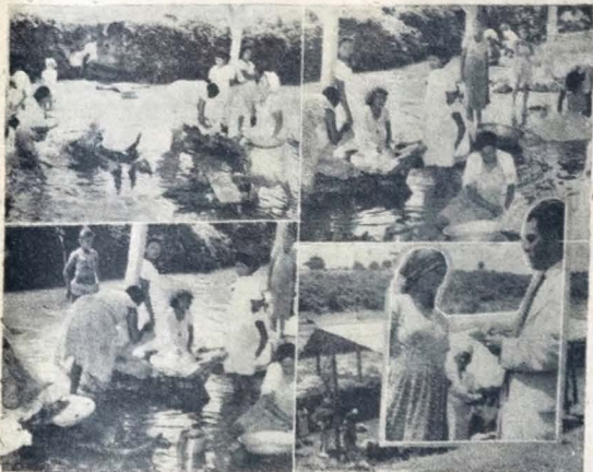
As lavanderias de Jaguaribe conhecem, hoje, condições mais favoráveis para a execução dos seus trabalhos cotidianos. O abrigo construído pelo Governo, e o corte feito no declive do terreno, onde foram adaptados degraus de madeira, muito contribuíram para facilitar os seus serviços. Acabou-se a lama. Agora voltar passado um aramado para estender roupa, e vão ser construídos vários banheiros. A situação dos pobres todo dia avança um passo. A direita, aparece uma lavadeira que fez questão de dizer ao repórter da sua gratidão.

As lavanderias construídas pelo atual Governo, beneficiando aparentemente insignificantes mas que são os pobres mulheres que ali moram, o dia inteiro podem calcular-lhe a importância, e, além do mais, beneficiar que não foi inaugurado e apresentado ao público como mais uma das realizações do Governo, resolvemos fazer-lhe uma ligeira visita e trazer ao público parabenos uma informação mais precisa sobre o que foi feito para atender a situação de cerca de 100 lavanderias que ali trabalham, espalhadas no sul e a oeste, sem que ninguém se lembrasse delas.