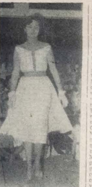
Senhoras da sociedade pernambucana exibem elegante modelo em algodão durante a última exposição de modas, no Recife, no benefício de entidades beneficentes de nossa cidade, no "Clube Astréa".

Invulgar interesse em torno dessa iniciativa — Exibição de interessantes modelos por senhoras de nossa sociedade — Em benefício do "Centro de Estímulo aos Trabalhos Domésticos" e do "Centro de Auxílio à Mãe Pobre" — A Rádio Taboara irradiará os detalhes do festival