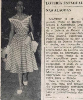
Senhorita da sociedade pernambucana, no desfile de modas realizado em Recife, exibindo interessante modelo de autoria de famosos costureiros franceses, a exemplo do que será feito, hoje, no "Clube Astrea".

bre assuntos ligados à agro-mineralogia. Como tivemos ocasião de anunciar, realizou-se, ontem, às 20 horas, na Sociedade de Medicina da Paraíba, uma reunião de iniciativa dessa entidade em (Conclue na 9.ª pag.)