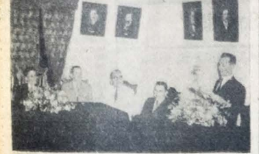
Fotografia colhida pelo reportagem fotográfica de A UNIÃO, durante a solenidade de inauguração da Galeria de Petrone de Academia Paraibana de Letras...

Inicialos os trabalhos do gramado central da Av. João Machado — Receberão esse benefício as ruas e avenidas pavimentadas recentemente — A Comissão de Pavimentação e o Serviço de Reflorestamento