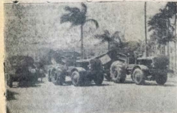
Foto tomada domingo passado, de frente do Palácio da República, quando ali ficaram as 4 Transportadoras, tipo Trator-Reboque que se destinavam ao Boqueirão. Cada uma dessas máquinas pode ser carregada em 30 segundos pela Excavador-Carregadora London que se acha no Porto de Cabedelo. Foto de cada 18 toneladas. Já partiram para as importantes obras do DNOCS, e sua colaboração é verdadeiramente inestimável.

A Excavador-Carregadora. Está em Cabedelo e seguirá para o Boqueirão por via férrea.