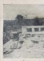
Ponte sobre o rio Lagradouro, construída na administração do prefeito Plínio Lemos

Para desenvolvimento do plano de auxílio ao lavrador campinense, também a municipalidade fez grandes despesas, na compra de máquinas