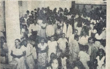
AUDIÊNCIA PÚBLICA DE ONTEM — A partir das 14h até cerca das 19 horas, recebeu o governador José Américo 326 pessoas, a todas atendendo com solicitude e dando solução aos seus casos, na medida das possibilidades da administração. Nos fotografias acima, colhidos pela objetiva da A UNIAO, vemos-se o Chefe do Governo, em companhia de auxiliares da administração, quando ouviu alguns populares e, em baixo, um aspecto parcial do grande numero de humildes conterrâneos, que procuraram, ontem, o governador do Estado.