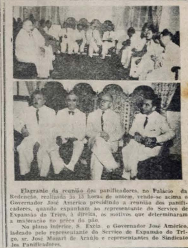
Flagrante da reunião dos panificadores, no Palácio da Redenção, realizada há 15 horas de ontem, vindo-se acima o governador José Américo presidindo a reunião dos panificadores, quando expunham ao representante do Serviço de Expansão do Trigo, a direita, os motivos que determinaram a maioração no preço do produto.