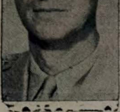
GENERAL MARK CLARK

SEUL, 17 (UP) — Os comunistas chineses, após vitória ou morte, frustraram as tentativas das forças sul-coreanas.