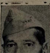
GENERAL MARK CLARK