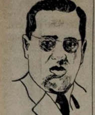
Gov. Amaral Peixoto