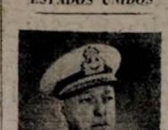
Renato Guillobel, ministro da Marinha do Brasil, partiu para os Estados Unidos...