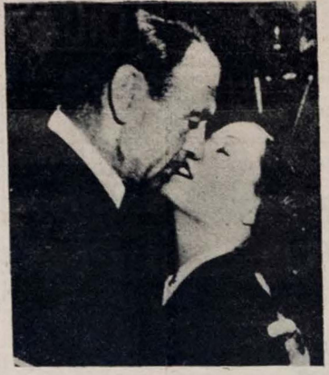
No proximo dia 15, a Century-Fox, apresentará ao público pe- ssoalmente, no Cine Plaza, a interessante e turbulenta comedia intitu- lada "AGORA ESTAMOS NA MARINHA", em que figuram como interpretes Gary Cooper e Jane Greer, em papeis bem in- teressantes pela maturação do desempenho.

Matinã: Na sua continuação apena- na sua pericia, tendo en- dade na impericia dos outros. U. E. T.