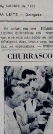
O churrasco mostra um aspecto do churrasco oferecido pelo Comando da Polícia Militar, no Horto Simões Lopes, do qual participaram autoridades civis e militares, pastas grãdas, oficiais e praças, em comemoração à data do aniversário de fundação daquela Corporação Militar.