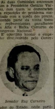
Senador Rui Carneiro