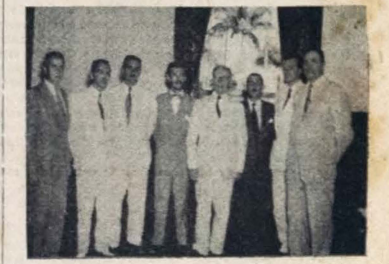
O FLAGRANTE acima foi tomado quando realizaram a visita ao Governador José Américo, membros da Comissão de engenheiros e elementos da classe trabalhadora de Campina Grande, sendo-se, ainda o deputado Severino Cabral