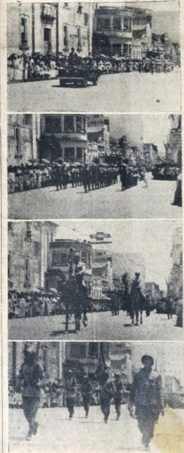
AS FOTOS acima foram tomadas durante a grande parada do dia 7 de Setembro, nesta cidade, vendo-se, as tropas da Guarda Federal, quando desfilavam pelas ruas da Capital. Na alta, o carro do Comandante; ao centro, a Banda de Música do Regimento "Vidal de Negreiros" e o Comandante do desfile; e abaixo, um aspecto da guarda da Bandeira Nacional