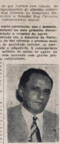
SENADOR RUY CARNEIRO

Encontra-se, no Rio de Janeiro, há alguns dias, uma representação paraibana de parlamentares e produtores do algodão, que foi à Metrópole do País, em vista de assuntos ligados à revisão dos preços estabelecidos em decreto presidencial sobre o financiamento do agave produto. A propósito, o Governador do Estado recebeu o seguinte telegrama, que diz do satefator: "O encaminhamento dos entendimentos levados a efeito no Rio de Janeiro: Levamos ao conhecimento do nobre eminente governador