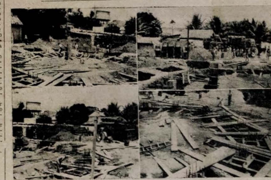
AS FOTOS acima foram colhidas pela objetiva de A UNIAO, na rua Diogo Velho, onde está sendo construído o reservatório d'agua, com capacidade para 20 milhões de litros...