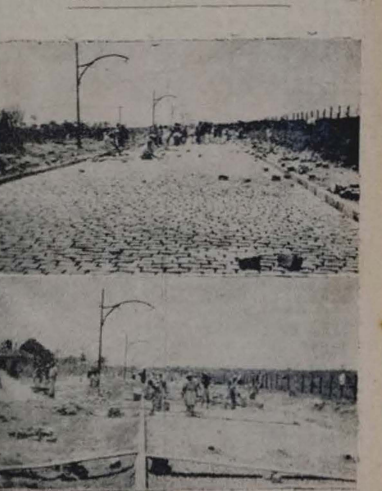
OS CLICHES acima foram tomados na Avenida Eplifaco Pessoa, nas imediações do antigo campo da Imbricitra, e por onde se vê, no plano de trabalho que a Comissão de Perfeccionamento da Cidade empreteu, obras de ampliação da via, que ligará a Capital ao aprastel recanto de novo Itorá.