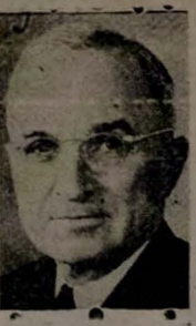
Pelo Gen. Eisenhower