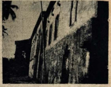
VELHOS PAREDOES DA GUIA — Os Carmelitas construíram sua primeira igreja na Paraíba na Guia, distante da cidade. Dentro do agreste, com a flora da região, exuberante nos seus cores, a cerca-la. Esta foto mostra os velhos paredes laterais da igreja, que foi concebida também, emoldurada pelo paisagem da terra. Velhas paredes da Guia que o tempo andou levando, mas que resistem ainda. Os coqueiros que aparecem à esquerda são um sinal de presença dos rios nordestinos na decoreta da obra maestra.