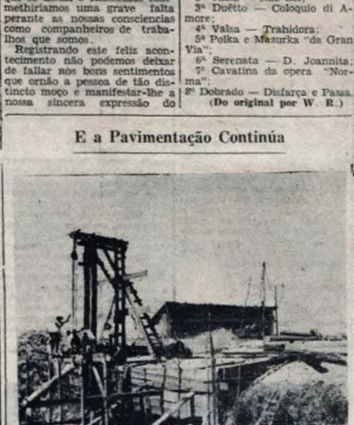
EM RITMO acelerado, proseguem os trabalhos da ponte sobre o rio Jaguaribe, no plano de pavimentação da estrada que liga esta Capital a Tambau. A parte da praça até a ponte já se acha concluída, enquanto que descendo do antigo campo de alagado, o atual empreendimento procura a outra margem do rio. Até o fim do ano estas obras de inestimável valor para a Paraíba estarão concluídas. A foto acima mostra um flagrante dos trabalhos da ponte