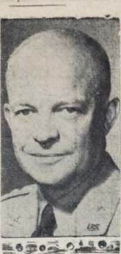
Afirmou o General Eisenhower