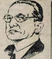
Sr. De Gasperi

Acreditava a mesma fonte que o presidente Syngman Rhee foi advertido de que o Governo norte-americano está decidido a ir adiante no que toca à conclusão do Pacto de Segurança Mútua e um prazo máximo de duração da conferência política.