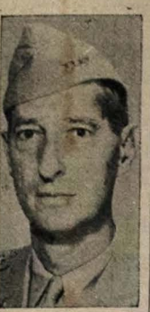
General Mark Clark

Mark Clark convoca os comandantes de Terra, Mar e Ar para uma conferência — Reconstituído pelos sul-coreanos o chamado MORRO DO VIGIA — Sangrentos combates corpo a corpo entre comunistas e aliados — Fortes operações aéreas contra os centros de comunicações e abastecimentos do inimigo