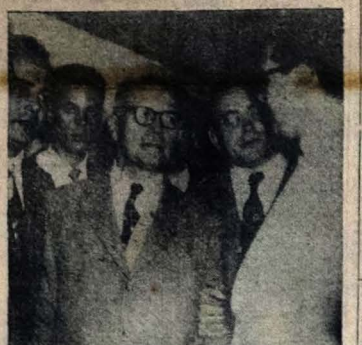
A foto acima fixa um aspecto da recepção prestada ao Ministro José Américo, quando da sua chegada ao Rio de Janeiro, a fim de assumir a Pasta da Viação, vendendo-se o ambiente paraibano idealizado pelo Vice-Presidente da República, sr. Café Filho, além de parlamentares e outras figuras de projeção do alto mundo político e social do País.