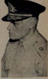
General Juarez Tavora

RIO, 21 (Agência Nacional) — Sob a presidência do sr. Aldo Calvet, diretor do Serviço Nacional de Teatro, e do sr. ... (text continues with details of the organization's formation and goals).