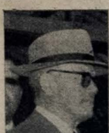
Ministro José Américo

Execução Imediata de Vários Planos de Emergência, de Acordo com as Províncias do Titular da Viação — Em Viagem para Esta Região o Diretor do DNOCS — Os Trabalhos nos Estados do "Polígono das Sêcas"