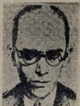
Sr. Gustavo Capanema