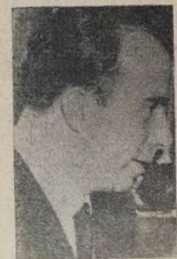
Ministro Hugo Gouthier RIO, 27 (Aspress) — A respeito da decisão presidencial cancelando a penalidade imposta ao Ministro Hugo Gouthier, o que permitirá ao referido diplomata exercer normalmente

Repercução da providência presidencial — Reabilitação perante o mundo diplomático — Declarações dos senadores Ferreira de Souza e Vitorino Freire