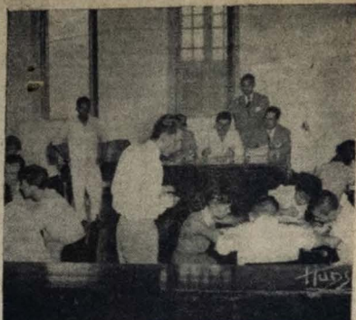
PROVAS NO SAPS — Realizou-se, ontem, um concurso de seleção dos funcionários do SAPS, nesta Capital, tendo-se, na foto, um aspecto das provas efetuadas

De uma publicação do Escritório Comercial do Brasil em Nova Iorque conclui-se o seguinte comentário: "O relatório anual da Companhia Federativa Nacional, que foi em parte divulgado pelo BRAZILIAN BULLETIN, do Escritório Comercial do Governo Brasileiro em New York, tem sido alvo de elucubros comentários por parte do público norte-americano, devido ao rápido progresso alcançado pela Usina de Volta Redonda. E a agudizada com interesse a Conferência Inter-Americana de Economia, de acordo com declaração do Ministro Oswaldo Aranha, se realizará em outubro próximo no Rio de Janeiro e a ela, deverão comparecer os Ministros da Fazenda dos diferentes países do Hemisfério Oriental.