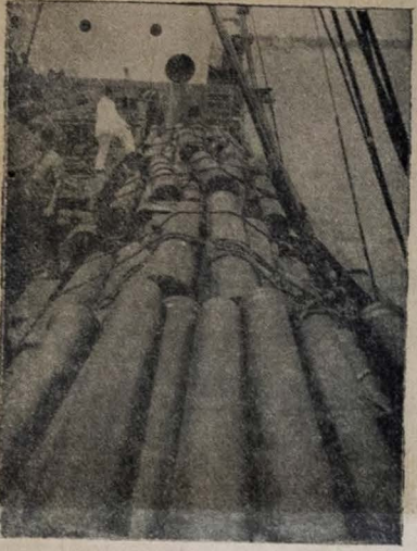
Imã ilustrate tomado pela reportagem fotográfica desta folha a bordo do cargueiro "Santa Marta", que transportou a esta Capital grande partida de tubos de ferro fundido...