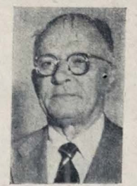
Sen. Virgínio Veloso Borges

Candidato à reeleição, como representante paraibano na Câmara Alta, onde vem desenvolvendo profícua atuação, o Senador Virgínio Veloso Borges deverá participar, aqui, da campanha política em