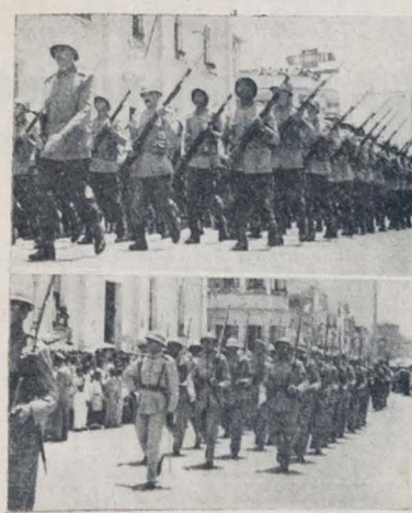
As folas acrílicas, formadas durante a parada militar e estudantil com que a Paraíba celebrou a passagem do Dia da Independência, mostram corpos de tropas do 15.º R. I. e da Polícia Militar, quando desfilavam nas principais artérias desta Capital, sob aplausos de grande número de povo que se comprimiu ao longo da Rua Duques de Caxias e lotava as imediações da Praça João Pessoa.