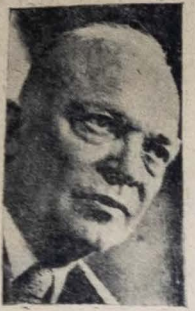
EISENHOWER Soleite declaração.