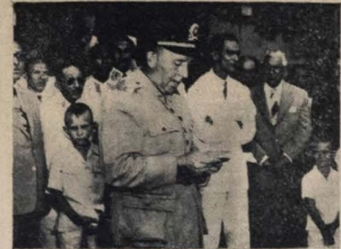
Na foto acima, o Comandante da Polícia Militar do Estado, quando agradeceu as homenagens prestadas aquela corporação, pela Escola Industrial de João Pessoa