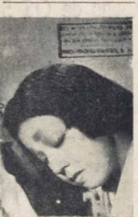
Uma cena do filme "RASHOMON", apresentado, ontem, no Cine Teatro Plaza.