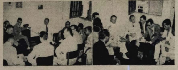
Aspectos colhidos durante a entrevista concedida, ontem, pelo Senador Ruy Carneiro à imprensa.

Recebe, o senador Ruy Carneiro, em entrevista coletiva, os representantes dos jornais da Capital — Os últimos acontecimentos em torno da vida politico-partidária do nosso Estado — "Há um desejo de colaboração ao programa de harmonização da família parabaína" — Aguardada a palavra do Ministro José Américo — Outras notas