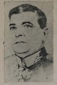
Gal. Zenóbio da Costa RIO, 13 (M) — O general Zenóbio da Costa desmentiu as notícias de que estaria apoiando e sustentando, como titular da pasta da Guerra, a candidatura do Ge-