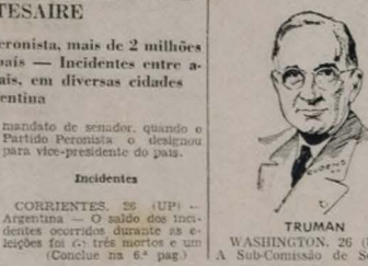
TRUMAN A Sub-Comissão Segurança

ca Interna do Senado polêmico, hoje, um documentário de 200 páginas, sobre a controversia iniciada pelo Secretário da Justiça, Herbert Brownell Junior. Como se recorda, este acusou o ex-presidente Truman de ter promovido conscientemente um espionagem comunista, acusação essa que provocou violenta reação por parte de Truman. O documento hoje publicado, não menciona o nome de Truman, mas o anterior Governo não deixou de ouvir as repetidas denúncias do Bureau Federal de Investigações sobre as atividades