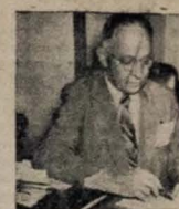
Sen. Virgílio Veloso Borges

Se os filhas apresenta alguma desonestidade, leve-o ao distrito para curatela. — SNEB.