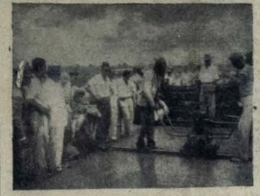
A PRIMEIRA PLACA DE CONCRETO DA ESTRADA JOÃO PESSOA-CAMPINA GRANDE — Realizou-se, ontem pela manhã, com a presença de Governador José Américo e altas autoridades, o lançamento da primeira placa de concreto na rodovia João Pessoa-Campina Grande, de que se trata fragmento a "A", setoria. Vi-se o Chefe do Executivo no momento em que observava o trabalho dos modernos maquinários.

Carta do sr. Raul Pilla, manifestando a disposição de manter os entendimentos que se fizeram necessários, contanto que correspondam aos supremos interesses do País — Aguarda-se a resposta do PDC e do PR