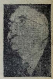
Foster Dulles principal a situação das Repúblicas americanas. Os países americanos não se encontram ante um grau (Conclua na 7.ª pag.)

Foster Dulles fez a primeira menção às Repúblicas americanas quando começou a passar em revista os perigos