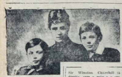
SEM SORTE... Sir Winston Churchill à direita, com a mãe e o seu único irmão. Churchill estudava em Harrow quando essa fotografia foi tirada.