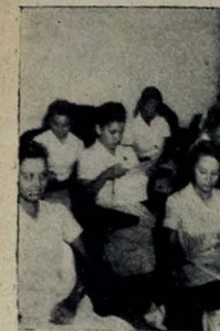
Vários cursos funcionam na Escola. Esta é uma flagrante numa sala de aula.