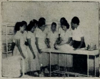
Sala prática de ortopedia na Escola de Enfermagem

Cerca de três dezenas de alunas estão matriculadas no Curso de Auxiliares de Enfermagem, que está sendo atualmente ministrado por um corpo de professores já bastante conhecido em nossos meios médico-universitários.