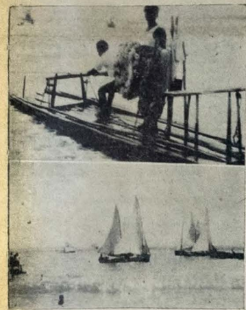
Ao alto, a jangada que transportou até à lancha da Capitania dos Portos a "corcheille" que foi lançada ao mar "in memoriam" dos mortos das Marilhas de Guerra e Mercante. Em baixo, barcos da Flotilha de Sálipes e jangadas de Tambau animando com a sua graça primaveril a ensaída de Santo Antônio, na manhã de ontem, por ocasião do encerramento da Semana da Marinha.

RIO, 13 — (ASP) — A respeito da notícia ontem largamente divulgada de que o general Canrobert da Costa havia aconselhado a governadora Juscelino Kubitschek a renunciar a sua candidatura à Presidência da República, e ninguém asseverou que a notícia não tem nenhuma fundamentação, posto que jamais falara isso ao governador moentões.