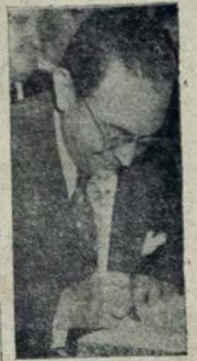
Presidente Café Filho

Além de manter a situação econômica do país, o presidente da República, ao chegar ao Rio Grande do Norte, fez um discurso em Natal, onde se tornou pior ainda.