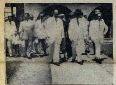
O Governador José Américo, acompanhado de autoridades locais, representantes das classes conservadoras e figuras do meio do alto mundo social e administrativo da Paraíba quando deixava o aeroporto, afim de embarcar.

o sr. Café Filho disse que a situação econômica do país é grave e que se tornou pior ainda. O presidente da República, ao chegar ao Rio Grande do Norte, fez um discurso em Natal, onde se tornou pior ainda.