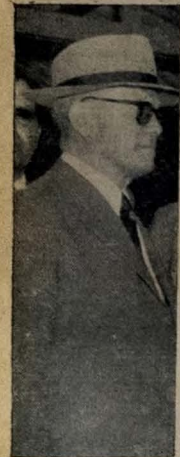
Governador José Américo

Novos contactos da imprensa carioca com o Chefe do Governo paraibano — Despertando vivo interesse nos meios políticos da Capital da República as atividades do Governador da Paraíba — Não vetou nem apresentou nenhuma candidatura — Também não se encontrou com o sr. Amaral Peixoto — Conferência com o sr. Nereu Ramos — Outras notas