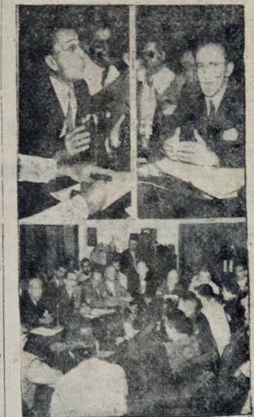
MESA REDONDA SOBRE A JOGATINA — Por iniciativa do Ministro Seabra Fagundes, da Justiça, vem de ser realizada, na Capital do País, importante reunião para discutir sobre a abolição do Poder Central na imprensa. A foto acima traz o debate da sessão, vespertino, em casa, a esquerda, o ministro Nelson Hungria, e, à direita, o Ministro da Justiça, sr. Seabra Fagundes, em flagrante durante os debates. Em baixo, um aspecto da mesa redonda.

integraram a Comissão de Justiça é permitir a votação do projeto de emergência afim de reformar (em alguns pontos apenas) a Lei Eleitoral aprovada ainda para as eleições de 1953.