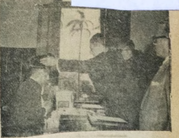
Tomou posse, ontem, no Tribunal de Justiça, o desembargador Darcy Medeiros, recentemente nomeado para aquela elevada função. O ato, que se revestiu de caráter solene, contou com o comparecimento de autoridades, advogados e pessoas graças: A honraria e solenidade.