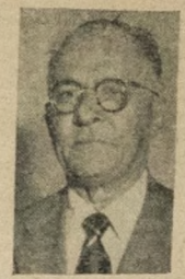
SEN. VIRGINIO VELOSO BORGES

Conforme estava anunciado, chegou ontem à esta capital o senador Virgínio Veloso Borges, presidente da Comissão Executiva do Partido Libertador, no Estado, e figura de relevância em nossos círculos políticos, onde o ilustre conterrâneo exerce real influência.