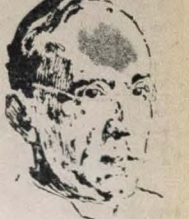
PAPA PIO XII