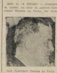
Gen. Camillel Pereira da Costa