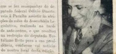
Sen. Ruy Carneiro

Alvo de várias homenagens, nesta Capital, o ilustre homem público — Significativa demonstração de simpatia, ante-onem, em Tambauzinho — Cumprimntado no aeroporto pelo Governador João Fernandes de Lima