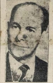
Min. Tancredo Neves

No programa "Falando Francamente", de Tupy, o Ministro da Justiça disse: "A oposição não tem outro objetivo senão tramular um clima golpista"