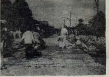
Trabalhos de pavimentação das principais artérias dos bairros da cidade.

A pavimentação das principais artérias dos bairros da cidade constitui um dos pontos de maior relevância do programa do Governador João Fernandes de Lima, já em execução. Assim é que, conforme noticiamos, estão sendo pavimentada a pista leste da Av. Cruz das Armas, único escaudor do tráfego que entra e sai da cidade para o comércio e o ponto de governança de todas as atividades de um dos subúrbios mais progressistas e populoso desta Capital. As fotos acima e ao lado mostram flagrantes dos trabalhos que ali realiza o Governo do Estado.