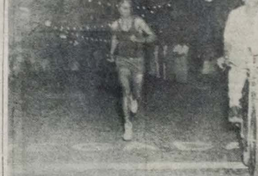
A equipe do 15 R.I. obtive a vitória. A foto mostra a chegada do vencedor.