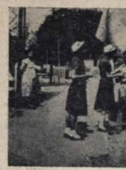
As Bandeirantes quando fazem a distribuição do Selo da Campanha Pro-Banco de Sangue, para ser afixado nos automóveis da Capital. Os motoristas estão empolgados — valiosa colaboração ao movimento.