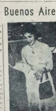
Gina Lolobrigida em Buenos Aires.