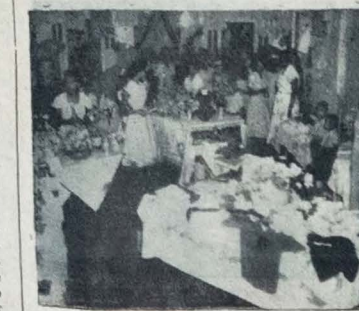
Flagrante colhido na sede do Núcleo de Assistência Social da Rua Riacho Velho, vendo-se parte da exposição de trabalhos, inaugurada ontem.

Em solenidade presidida pelo Governador do Estado — Inaugurada a Exposição dos Trabalhos executados