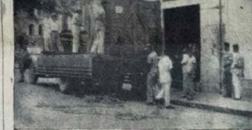
As decimbarcer, ante-ontem, a "Eichhof", Pésos: 2,26 quilos.

Agora, entretanto, voltando mais uma vez, suas vistas para o importante problema, determinou o Governador José Américo medidas de grande alcance para solucionar os problemas básicos de A UNIAO e Imprensa Oficial, emanando toda a maquinaria de linotipos com im-