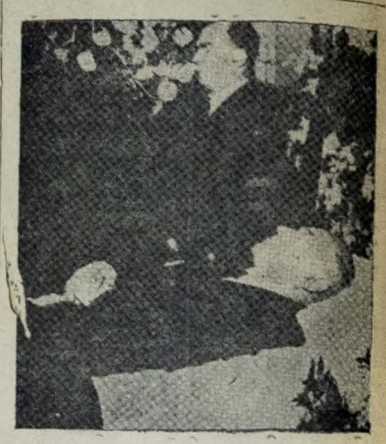
NOVA YORK — O corpo de Andrei Vishinsky exposto em câmara ardente na sede da delegação soviética à ONU. Ao lado veuando o corpo, vê-se o embaixador russo nos Estados Unidos, Georgi Zarubin.