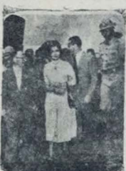
GALERIA L'OLLEBROIDA — Esta "galeria" L'ollobroida mostra dois trabalhos exibidos pelos repórteres estrangeiros, quando de passagem da Itália artista italiana pelo Rio. Oms prático de trabalhos em rádio e jornal, como se se na foto da direita. Costou de "Cangacristo", que considera uma grande produção. A esquerda, fortemente guardada, pela polcia. Gims, acompanhada do seu esposo, no momento em que desembarcaram no aeroporto internacional do Galeão. (Texto na 6.ª pag.)

LONDRES, 27 — (UP) — O protesto dos Estados Unidos contra a condenação de norte-americanos na China Comunista, foi afinal entregue em Londres pela chancelaria britânica. O consul norte-americano em Genebra tentou, durante toda a semana (Conclua na 6.ª pag.)