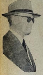
Gov. José Américo