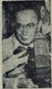
Pres. Café Filho

Sómente pelos meados de janeiro, irá o Chefe da Nação inaugurar a Ferrovia Brasil-Bolívia