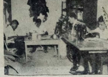
Uma oficina de sapataria funciona no Educandário "Eunice Weaver", preparando no ofício do artesanato os filhos dos hansenianos