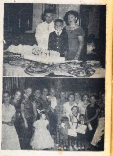
Comunidade uma mesa de desjejum no restaurante social desta cidade...