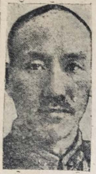
Chiang Kai Shek

Atualmente existe na Argentina a fábrica das indústrias aeronáuticas e mecânicas do Estado, que produz entre 5 e 10 mil automóveis anualmente; bem como duas fábricas pequenas, a "Automotores Argentinos" e a "Cisitalia", que foi transferida completa da Itália para este país (Conclui na 7ª pag.)