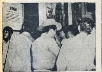
Noticiando em primeira mão o êxito das medidas adotadas pelo Governo do Estado, com a colaboração da COAP, para debelar a crise do fornecimento de carne verde à população da capital, A UNIAO affixou um "placard" no Ponto de Cem Reis na tarde de ontem, verificando-se, então, grande afiluição de pessoas que se repositaram pela solução do grave problema. A foto acima foi colhida no local onde foi afixado o "placard".