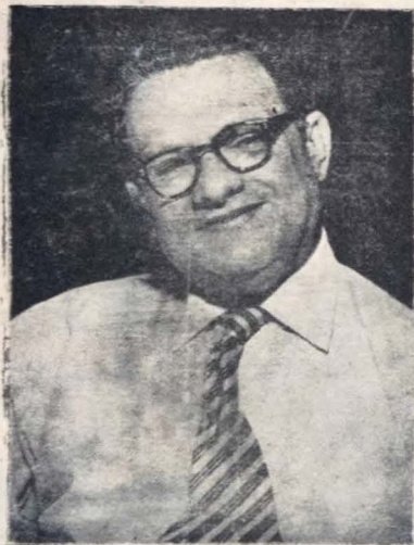
Escritor José Lins do Régo

LONDRES, 20 (UP) — O Ministério Exterior do Reino das Relações Exteriores foi elevado pela rainha Elizabeth à dignidade de Cavaleiro da Ordem da Jarreteira. "O único outro político inglês a receber esta mais alta dignidade hereditária da Grã-Bretanha nos últimos nos foi o sr. Winston Churchill.