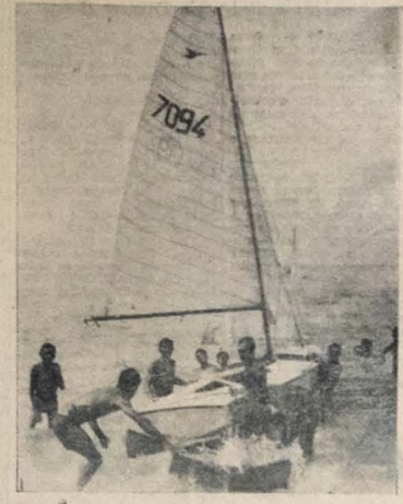
A PARAIBA NO 3º LUGAR — Realizado, sábado e domingo últimos o Campeonato Brasileiro de SNIPES, com a participação dos Estados de São Paulo, Pernambuco, Rio Grande do Norte e PARAIBA, o nosso Estado conquistou o 3º lugar, tendo a guarnição de Pernambuco sido sagrada campeã. A foto mostra um aspecto da entrada da última regata que representou a Paraíba no certame.

Os clubes com os quais as regatas começaram com a etapa anterior.