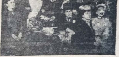
Grupo que participa da apresentação de "The Matchmaker"