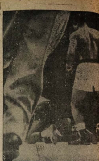
JACKSON CAI — O emprego de peso Floyd Patterson está de pé olhando para Jackson, depois de haver vencido no primeiro sítio de quibô rounds de sua luta em New York.