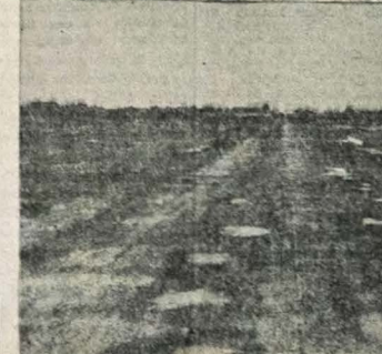
A recuperação e o revestimento da estrada Antenor — Marizópolis, que deveria terminar em fins de corrente mês, custará ao D. E. R. o importante de dois milhões e setecentos mil cruzeiros. Os 13 quilômetros da área restaurada e revestida dão um total de vulto dos trabalhos. A foto mostra

Em matéria de pavimentação de estradas ainda nos encontramos bastante atrasados. Os números acima demonstram a posição do Brasil, em relação aos demais países da América Latina.