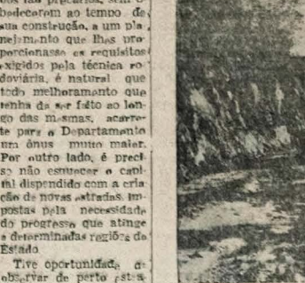
Um aspecto da serra de Teixeira antes de ser revestido. O terreno pedregoso torna a subida ainda mais difícil, sem falar no perigo que ameaça o veículo que por ela tem de transitar.