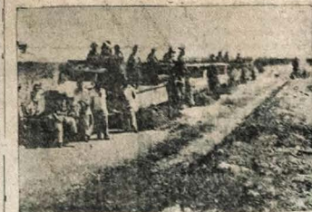
Estrada Antenor Navarro — Marizópolis — Caminhões particulares contratados pelo D. E. R. descarregam material para restauração de um dos trechos da estrada Antenor Navarro — Marizópolis.