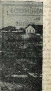
A recuperação e o revestimento da estrada Antenor — Marizópolis, que deveria terminar em fins de corrente mês, custará ao D. E. R. o importante de dois milhões e setecentos mil cruzeiros. Os 13 quilômetros da área restaurada e revestida dão um total de vulto dos trabalhos. A foto mostra