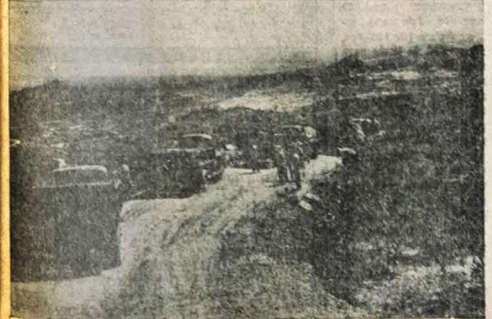
Caminhões — Escavantes de frota do D. E. R. nos serviços de revestimento da serra de Teixeira. E curiosos assim que caminhões particulares não trabalham nesse trecho, por ser o mesmo perigoso e acidentado. Todos os carros da Terceira Residência, (Patos), estão sendo empregados no revestimento da

Construção e Conservação de qualquer departamento, poderia estar, ainda se trabalhasse dentro os serviços de conservação que são sempre levados a cabo pela Divisão de Construção e Conservação do DER, destacando-se pela importância O DER da Paraíba conforme foi declarado linhas acima, tem a seu cargo a conservação de uma imensa rede rodoviária. E um trabalho difícil que exige equi-