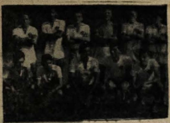
A foto acima é a poderosa equipe da "Revisão", que tudo fará pela conquista de mais uma vitória.

Assim, naquella dia, pelas 8 horas da manhã, no Campo da Cruz das Armas, estarão frente a frente os quadros da Revisão de esta fôlha e "O Norte", prometendo o primeiro vencer bons e moventados lances estor-