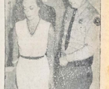
EPIDEMIA RANGUM, 20 (UP) — Uma epidemia de varicela que castiga há dois meses a província birmanesa de Kachina, provocou a morte de trezentas pessoas. Foram atingidas duzentas aldeias e assassinados três mil casos.

INFORMA RIO, 20 (A União) A VARIG informa com referência ao avião PP VDA que esse aparelho achava-se em viagem de transferência técnica em passageiros a bordo, quando o Comandante pôs-se fora de ar por motivo de mau tempo na parte norte do país. Os onze tripulantes a bordo, dez saíram ileso e os sete entraram em Ciudad Trujillo. O 11 tripulante, o Comissário Scherer, infelizmente se encontra desaparecido. As pesquisas continuam. O avião está sendo procurado nos Estados Unidos pela quantidade de dois milhões de dólares.