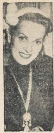
ESTA É A SUA PROVA - A atriz norte-americana Susan O'Hara negou haver jogado um bilhete amoroso em uma cena em um palco de uma casa de Hollywood com um amante hispano-americano, como se tem afirmado durante o processo que lhe move a revista "Confidential" no foro criminal. Ela afirma que tem um passaporte visado para provar que estava atuando em uma fita na Europa na data em que se diz que ela estava nos braços do hispano-americano não identificado. Disse-se que esta fotografia dela foi tomada em Londres, faz quase quatro anos quando acabava de regressar da Espanha. (Telefoto "UP").

Ainda esta semana entregará a mês da Câmara a proposição - Conferência Eduardo Gomes-Pedro Aleixo - Abordado o momento político nacional - O andamento do processo contra Lott - Ainda o voto do analfabeto