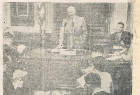
ACUSOU OS RUSSOS - Aqui vemos o Presidente Eisenhower durante a última entrevista que concedeu aos repórteres em Washington. Nela o Primeiro Mandatário norte-americano acusou a União Soviética de estar tratando de apoderar-se da Síria.

EMPREGARÁ RIO 28 (Asapress) - O Ministério da Agricultura empregará uma verba de 10 milhões de cruzeiros para estudos, sondagens e prospeção das jazidas minerais na Bahia, isto de acordo com o convênio firmado entre o Governo Federal e o Estado. Vários minérios serão estudados, inclusive, cobre, chumbo e outros de maior importância econômica para a Bahia.