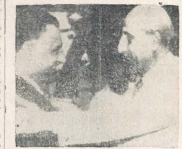
NASSER RECEBE O PRESIDENTE SIRIO - O Presidente do Egito, Gamal Abdel Nasser (à esquerda) aparece saudando o Presidente da Síria, Shukri Kuwaty ao chegar este ao Cairo procedente de Damasco para uma visita de três dias durante os quais será submetido a um exame médico.

REGULAMENTO RIO, 28 (Asapress) - Revela-se que a Comissão de Justiça da Câmara terminou a análise do projeto regulamentando o direito de greve, voltando (Conclui na 4ª pag.)