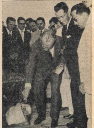
No flagrante, o Governador Flávio Ribeiro, no momento em que dava início simbolicamente, aos trabalhos de ampliação do nosso cais acostável.

RIO, 23 — Comunicamos vossa Comissão Defesa Algodão Nordeste foi recebida ontem Presidente República a quem fez entrega segundo memorial reclamando, contra prejos mínimos algodão