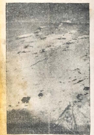
A TERRA VISTA DE UMA ALTURA MUITO GRANDE — A curva da terra é vista de uma altitude muito grande nesta fotografia que foi tomada pelo major David O. Simons, o médico da Força Aérea norte-americana que estabeleceu um novo record de altura ao ascender a 102.000 pés em um globo.