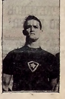
TEMPESTADE, jogador de futebol brasileiro.

Aluga-se a casa n. 710 na Av. Almirante Barroso, a tratar no Banco do Povo S.A.