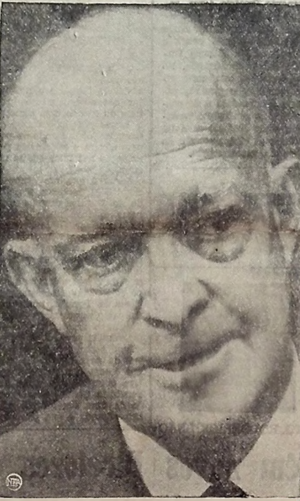
INDICE DE RECESSÃO NOS EE. UU. É MENOR — O Presidente Dwight Eisenhower aparece aqui durante a última entrevista que concedeu aos periodistas de Washington na qual disse que a recessão de que padecia os Estados Unidos era menor.

O filme, que se trata de uma adaptação para o cinema do livro de Goya, foi produzido em colaboração com a Itália e os Estados Unidos. O único problema era, no plano técnico, a escolha do ator para o papel do protagonista. O produtor italiano Vittorio Locci Chiappesi, através de um amigo de Lina e Luciano, em Ferrara, encontrou um ator que narra a vida de Goya através das imagens das obras de arte de Goya.