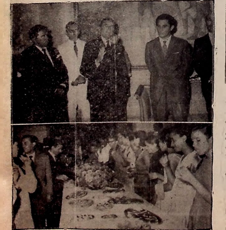
Flagrantes do coquetel oferecido aos trabalhadores paraibanos pelo Governador Pedro Gondim. Ao alto, está o Senador Argemiro de Figueiredo, representante do sr. João Goulart, presidente do Partido Trabalhista Brasileiro. Em seguida, o Chefe do governo fez breve relato de suas atividades a frente do governo da Paraíba especialmente

ROMA, 13 (UPI) — O jornal independente "Die Welt" publica hoje uma entrevista concedida por Chen Yi, ministro chinês do Exterior, na qual o seu país dispõe de bombas atômicas. Comentando esta declaração, acredita o "diferencial" em jornal.