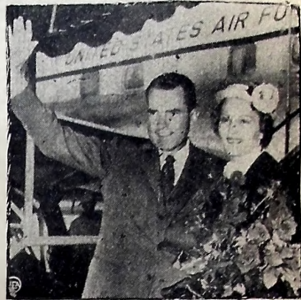
Nixon e sua esposa, vítimas de vexames na Venezuela

PORTALEZA, 12 (Asapress) — Acaba de chegar a Portaleza o navio "Campeiro" transportando nova remessa de gêneros alimentícios consignados a COAP, destinados ao serviço de socorro aos flagelados. Informa-se, ainda, que outro navio, o "Comandante Lira" deverá chegar hoje a esta Capital com 5 mil sacos de farinha para os flagelados.